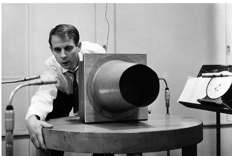
prise vers l'intérieur

L'idée avec le micro 4-D Oktava en tétraèdre ou autres [1]: , c'est de faire des prises en bougeant, rapprochant/éloignant, tournant, retournant, le multimicrophone autour et à l'intérieur de l'instrument joué ainsi que l'instrument lui-même. Les 6 micros Oktava que dispose le studio permettront de réaliser des prises triphoniques, quadriphoniques, pentaphoniques et hexaphoniques vers l'intérieur en opposition au 4-D Oktava tétraphonique qui prend vers l'extérieur .