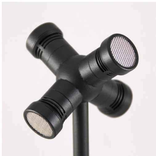
prise vers l'extérieur